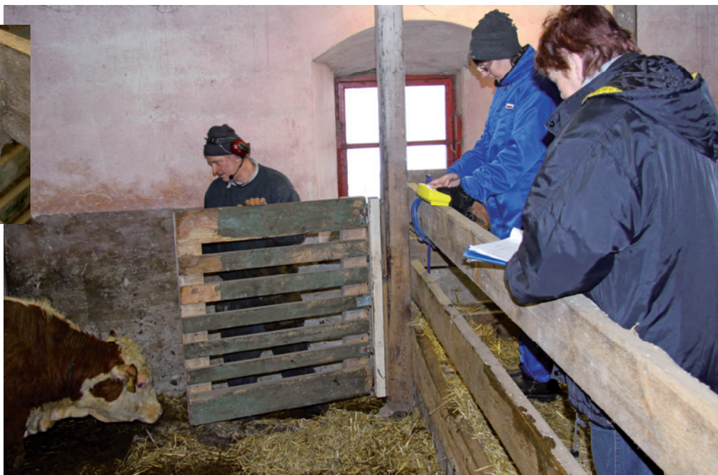
Vägterminalen rationaliserar vägningsarbetet. Vikterna överförs sedan till PC-KAP

Programmet, som är utvecklat i samarbete med Truetest, kommer